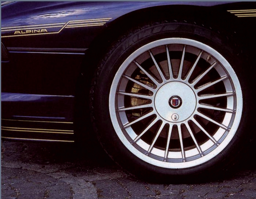
18" mit MICHELIN