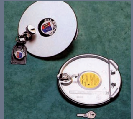
abschließbarer Aluminium Druckgußdeckel

ALPINA Radsätze ohne Bereifung mit abschließbaren Aluminium Druck- gußdeckeln und Metallventilen.