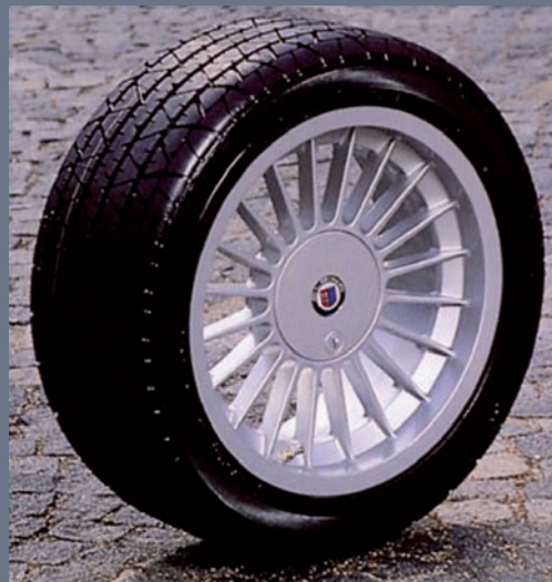
17“ mit MICHELIN

*Bei Fahrzeugen mit AHK (aktive Hinterachs-Kinematik) ist die Montage nur bei ALPINA möglich