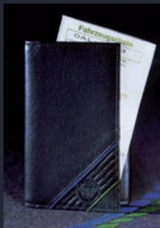
Fahrzeugscheinmappe feinstes, schwarzes Nappaleder mit geprägtem ALPINA-Emblem und eingenähtem Lederstreifen in den Farben Grün und Blau. Bestell-Nr. 76 00 133