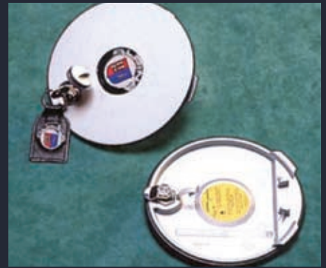
abschließbarer Aluminium Druckgußdeckel