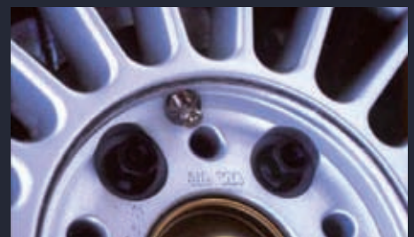
Ventil in der Radnabe integriert