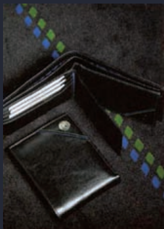
ALPINA Geldbörse feinstes, schwarzes Nappaleder, elegantes Seidenfutter, ALPINA- Emblem, geprägtes Metall, Einstecktaschen für Geldscheine, Kreditkarten- fächer, Hartgeldfach. Bestell-Nr. 76 00 136